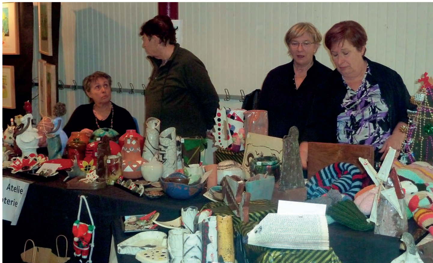
Quelques dames de la poterie au marché de Noël

Nous éprouvons toujours autant de plaisir lorsque nous arrivons au moment de la « découverte ».