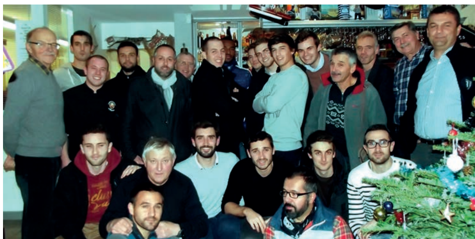
Les Seniors ravis de leur sortie à la Crêperie auzielloise