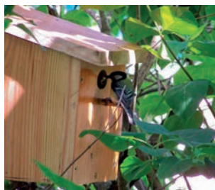
Les niochirs à mésanges

Méthodes de luttes complémentaires, ces dispositifs contribuent à réguler les populations de chenilles urticantes de la processionnaire des pins au printemps