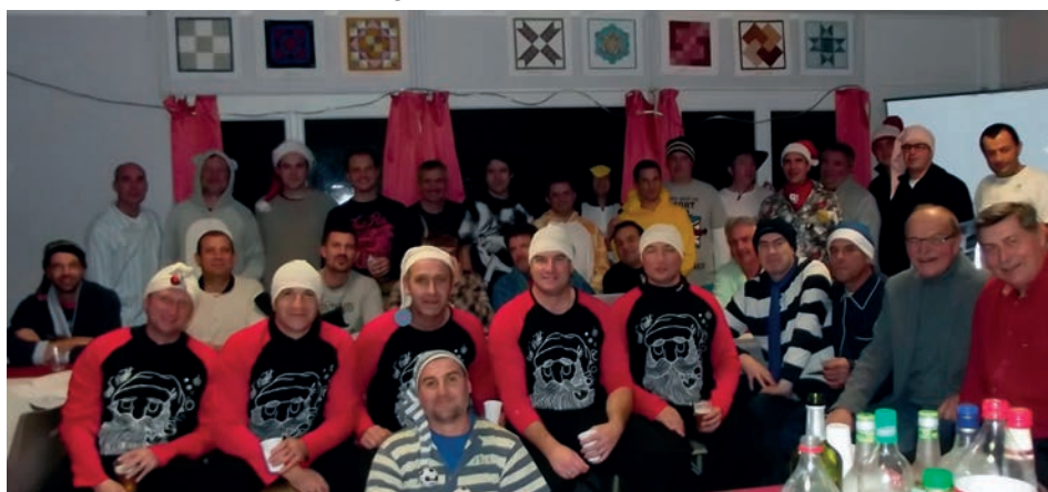
Les Vétérans au tout début de leur soirée Pyjama